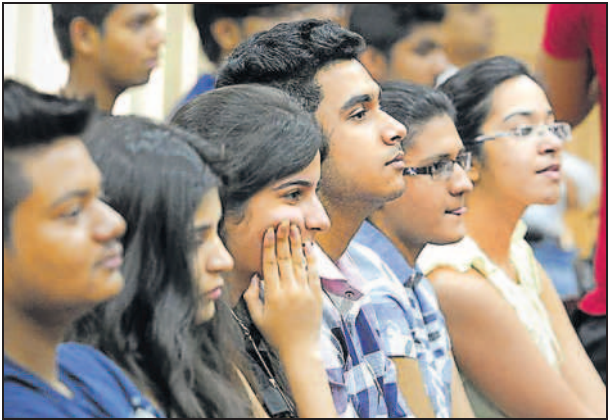
An event such as Speak for India allows students to improve critical thinking and public speaking skills.

The journey of Speak For India started in 2014 when the board of directors of the Bank decided to launch an activity that aims at empowering the youth of this country. In the last five years, Speak For India was held in different parts of the country including Kerala, Tamil Nadu, Karnataka and Maharashtra. In 2018, over two lakh students from 4,450 colleges across four states participated in the contest which saw 12 winners in different categories.